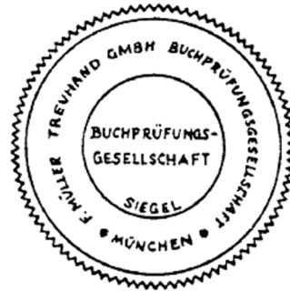
Siegel einer Buchprüfungsgesellschaft