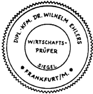
Siegel eines Wirtschaftsprüfers