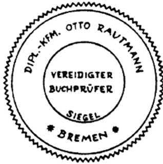
Siegel eines vereidigten Buchprüfers