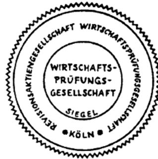
Siegel einer Wirtschaftsprüfungsgesellschaft