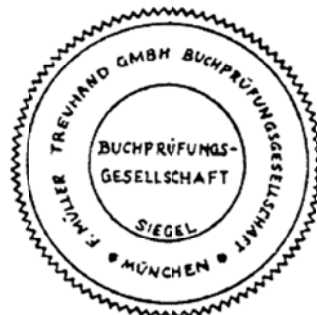
Siegel einer Buchprüfungsgesellschaft