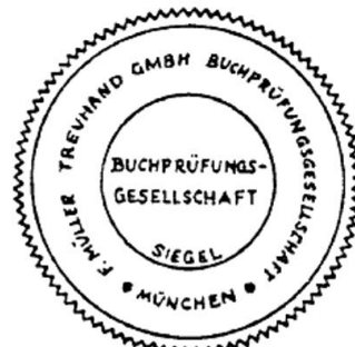
Siegel einer Buchprüfungsgesellschaft