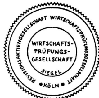
Siegel einer Wirtschaftsprüfungsgesellschaft