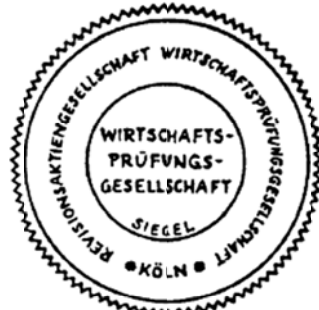
Siegel einer Wirtschaftsprüfungsgesellschaft