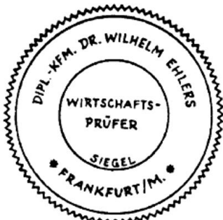
Siegel eines Wirtschaftsprüfers