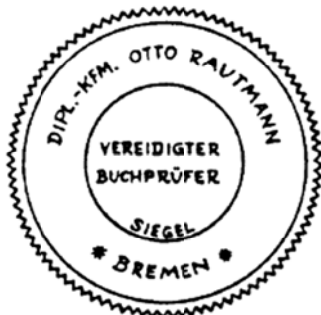
Siegel eines vereidigten Buchprüfers