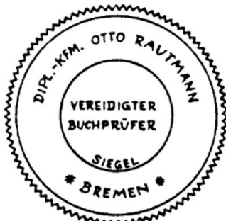
Siegel eines vereidigten Buchprüfers