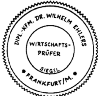
Siegel eines Wirtschaftsprüfers