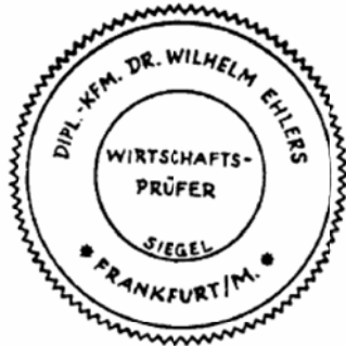
Siegel eines Wirtschaftsprüfers