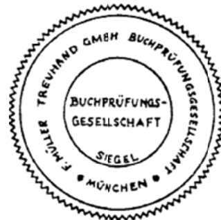
Siegel einer Buchprüfungsgesellschaft