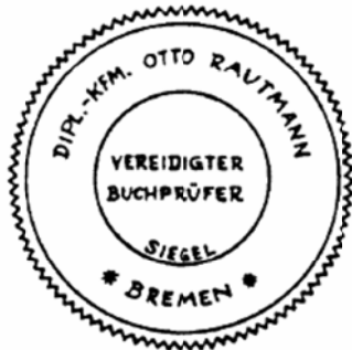
Siegel eines vereidigten Buchprüfers